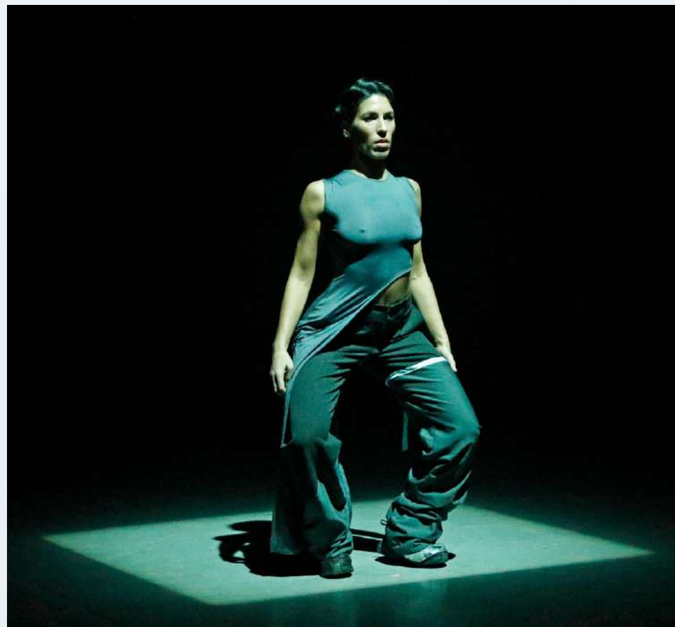
YOU ARE NOT A GHOST @MERCATDELESFLORS

DISOCIACIÓN FÍSICA, RÍTMICA Y ESPACIAL. MULTIPLICIDAD DE OPERACIONES AISLADAS SUCEDIENDO EN SIMULTÁNEO EN TIEMPOS DIVERSOS.